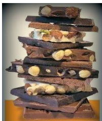
Salon du chocolat Club KIWANIS de RODEZ